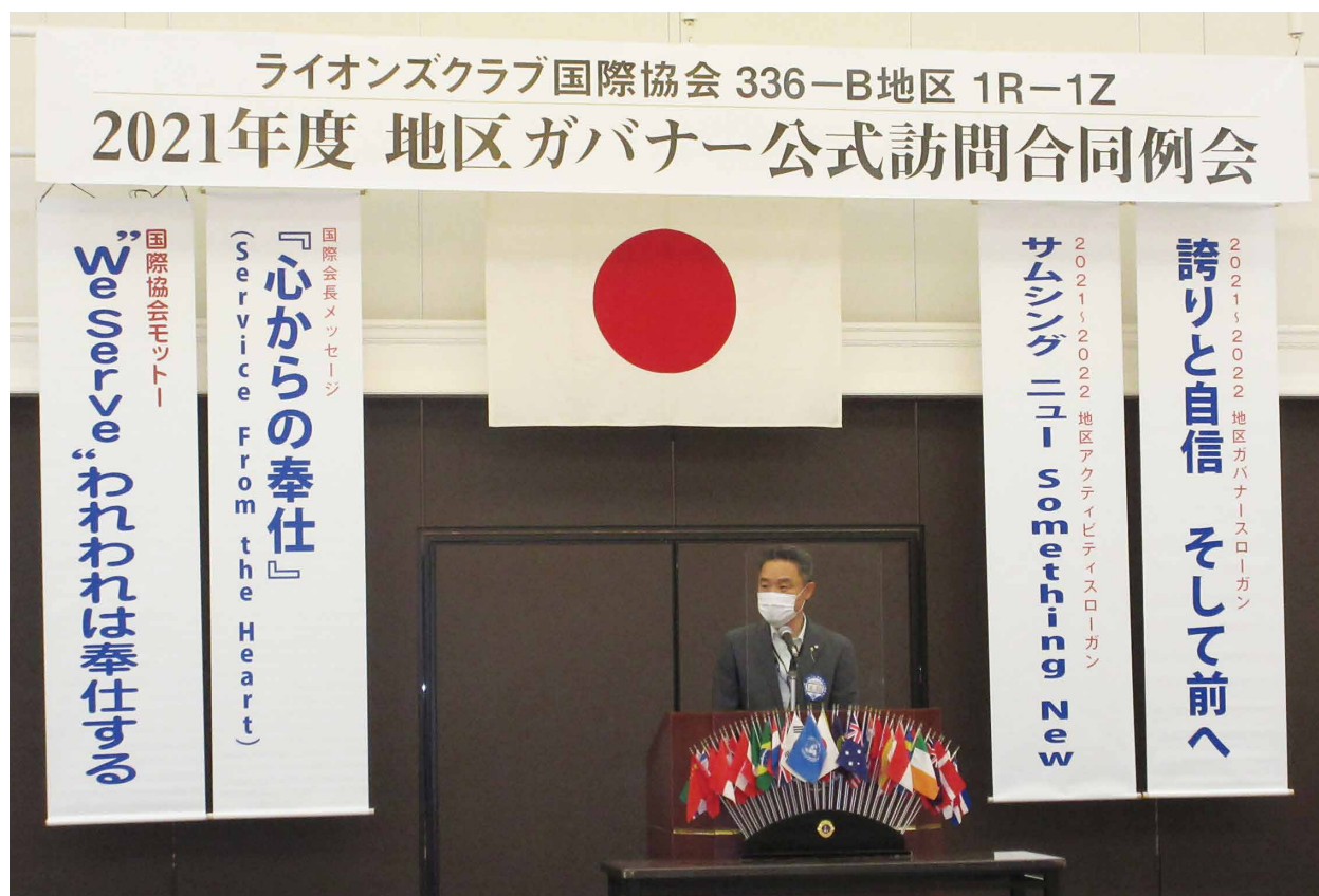
地区ガバナー公式訪問合同例会