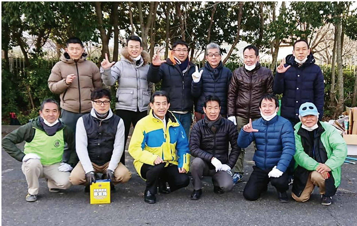
フリーマーケット（岡山サウスビレッジ）