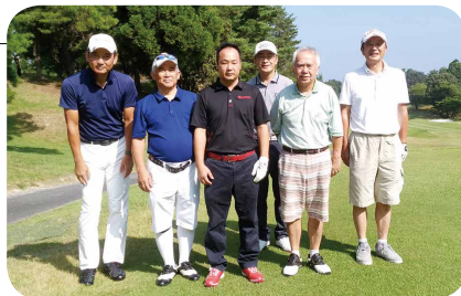
成 績 表