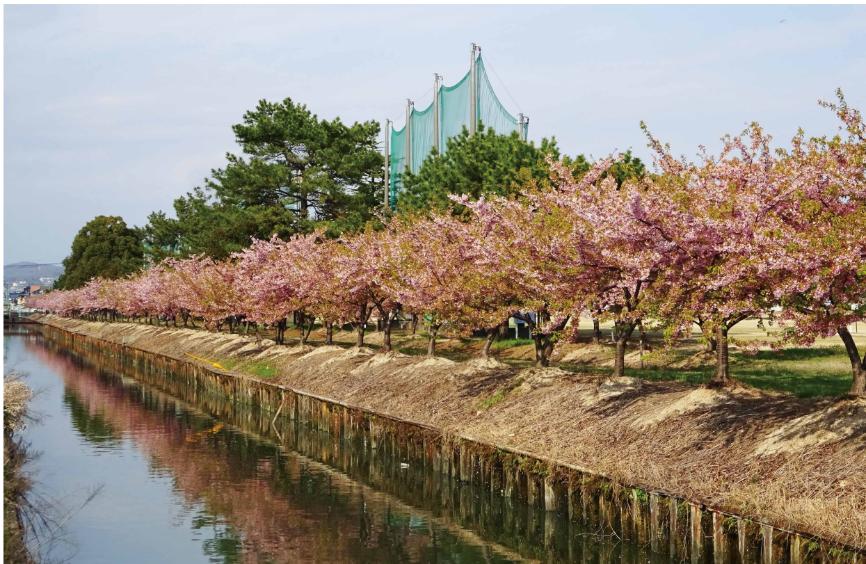
花回廊 河津桜 (岡山市南区)