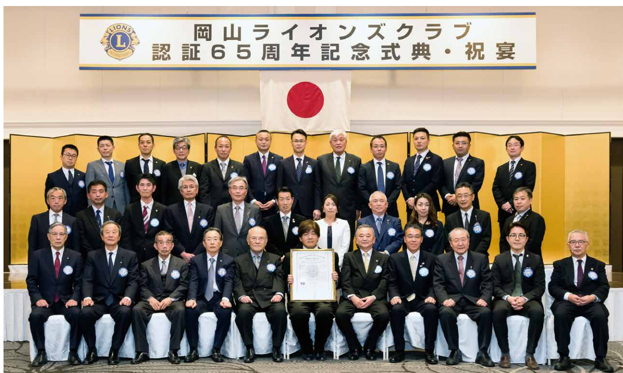
認証65周年記念大会