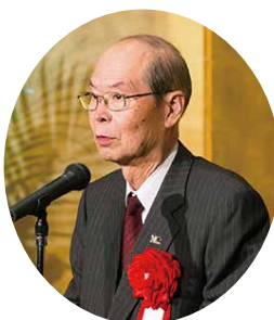
元地区ガバナー 一井 淳治