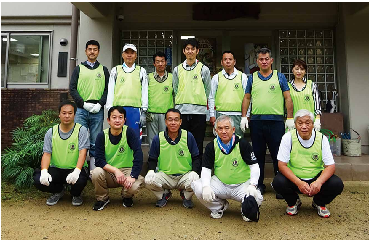
ももその学園清掃奉仕活動