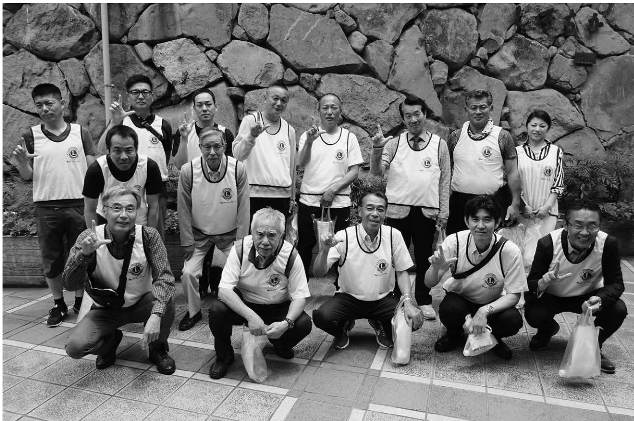
第9回 青少年健全育成薬物乱用防止パレード