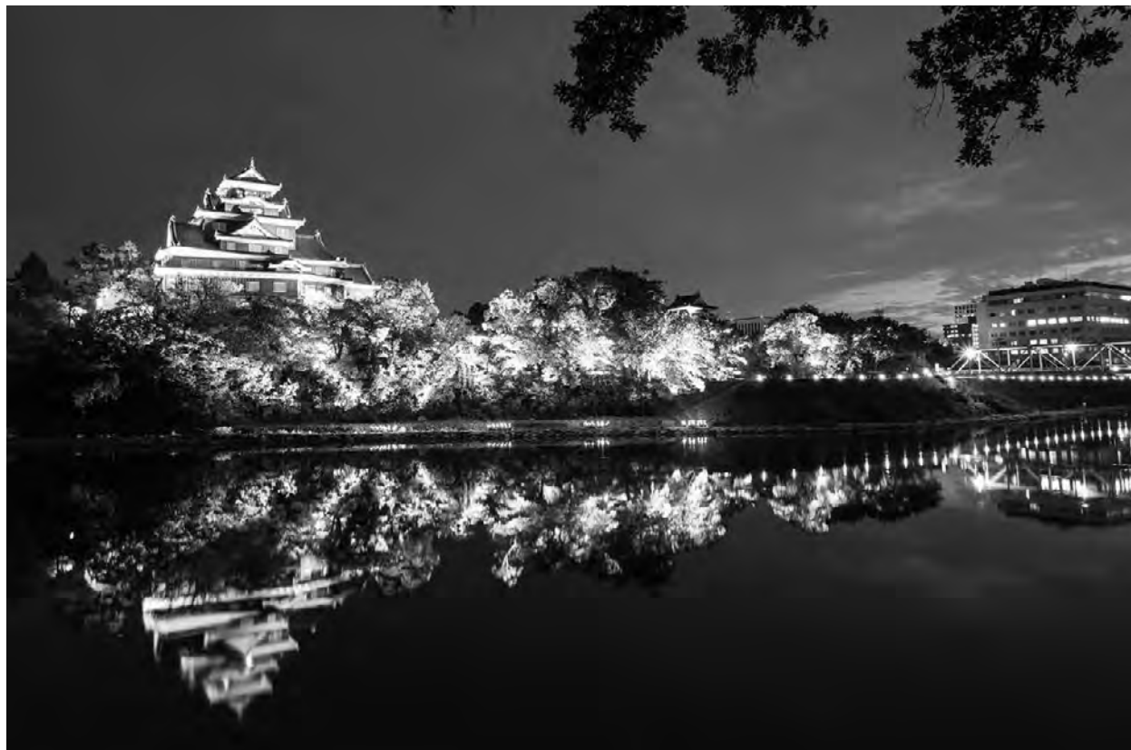
岡山城（烏城灯源郷）