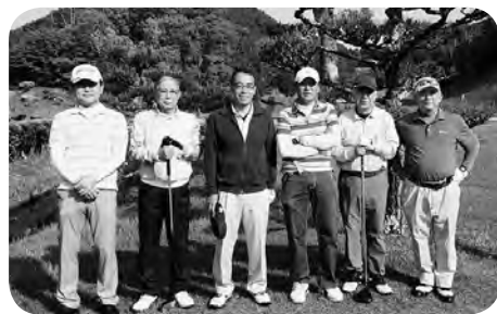
成 績 表