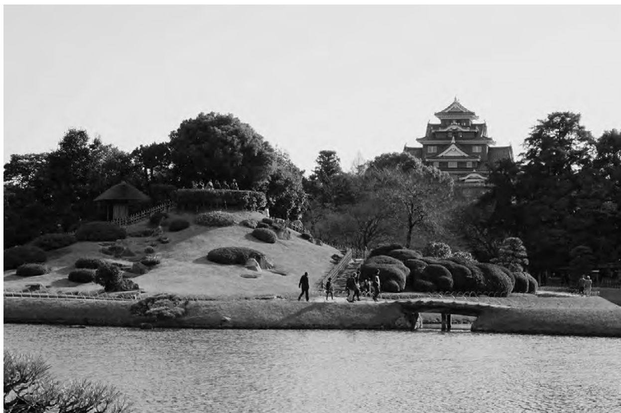
新春の岡山後楽園