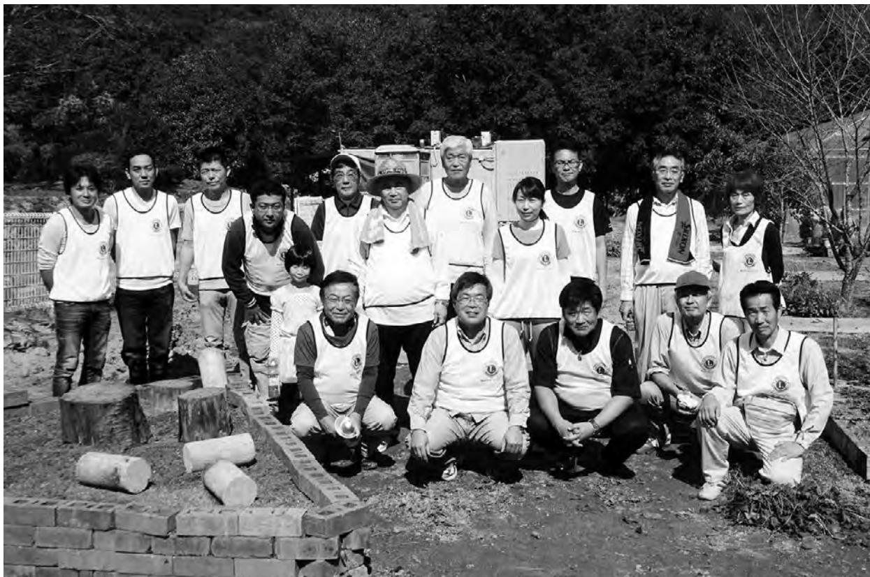
ももその学園清掃奉仕活動