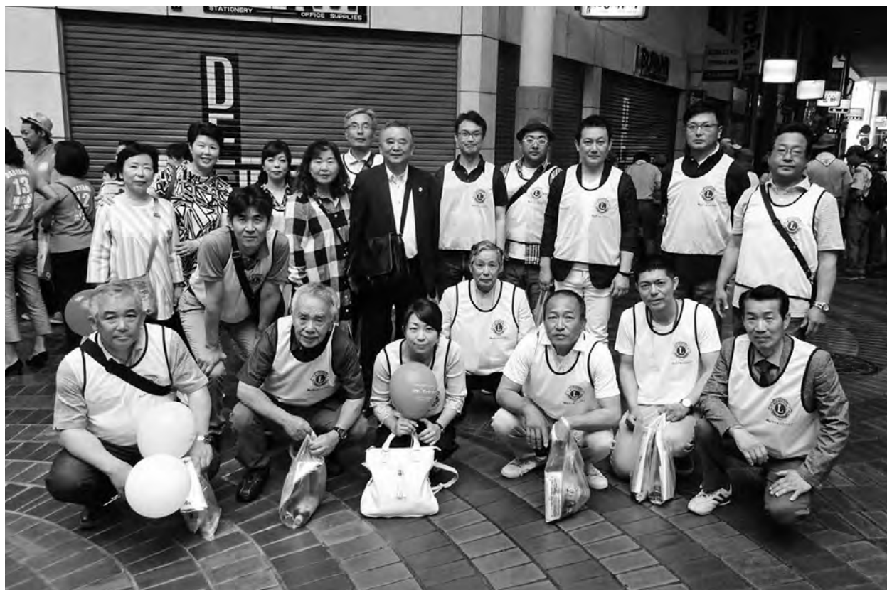
第8回 青少年健全育成パレード