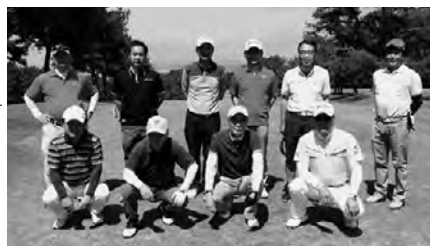
成 績 表