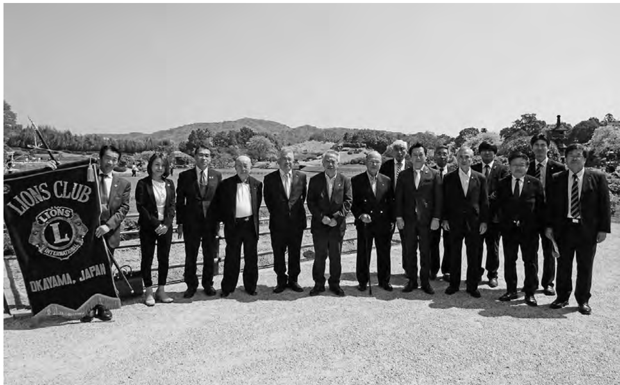
お花見会（岡山後楽園）