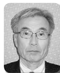
会 計 祇 園 譲