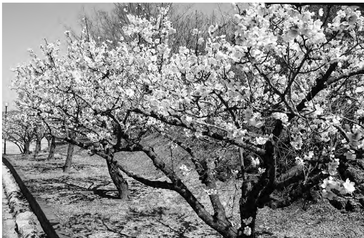
岡山市東区「神崎梅園」