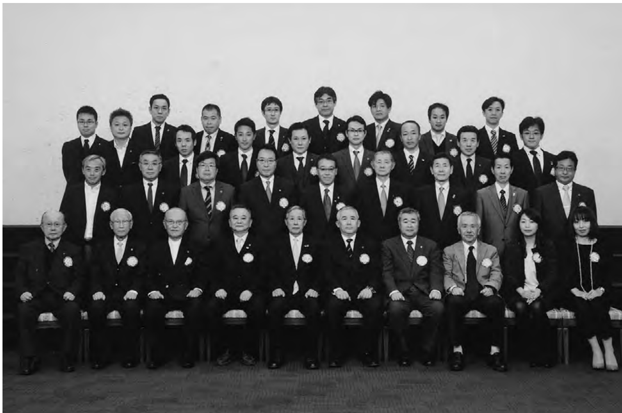
チャーターナイト62周年記念例会（2月第1例会）