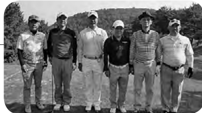
成 績 表