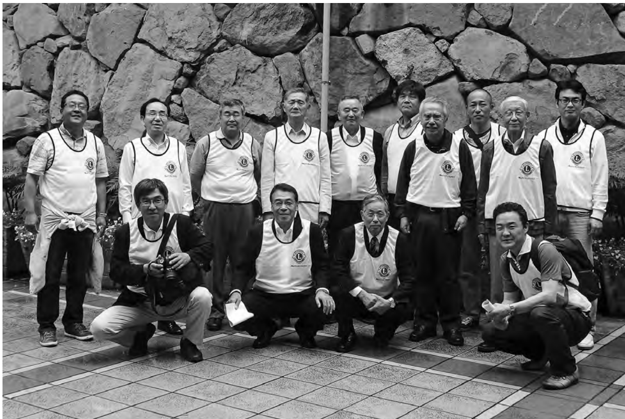
第6回 青少年健全育成パレード