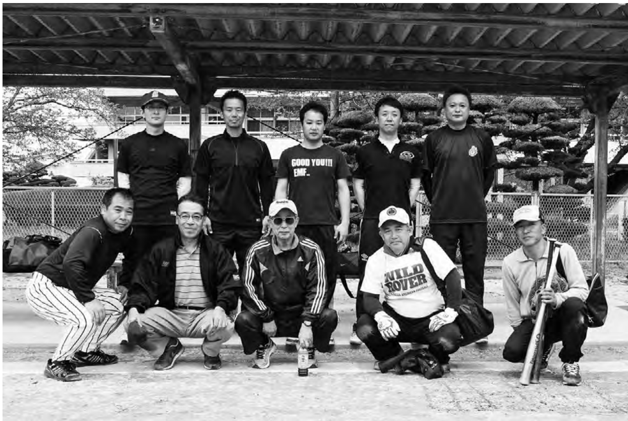
ライオンピック ソフトボール大会