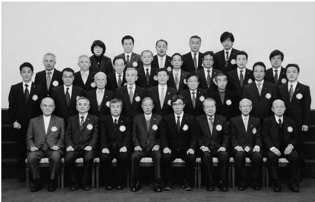
チャーターナイト61周年記念例会（2月第1例会）