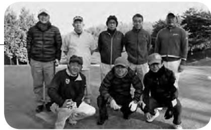
成 績 表