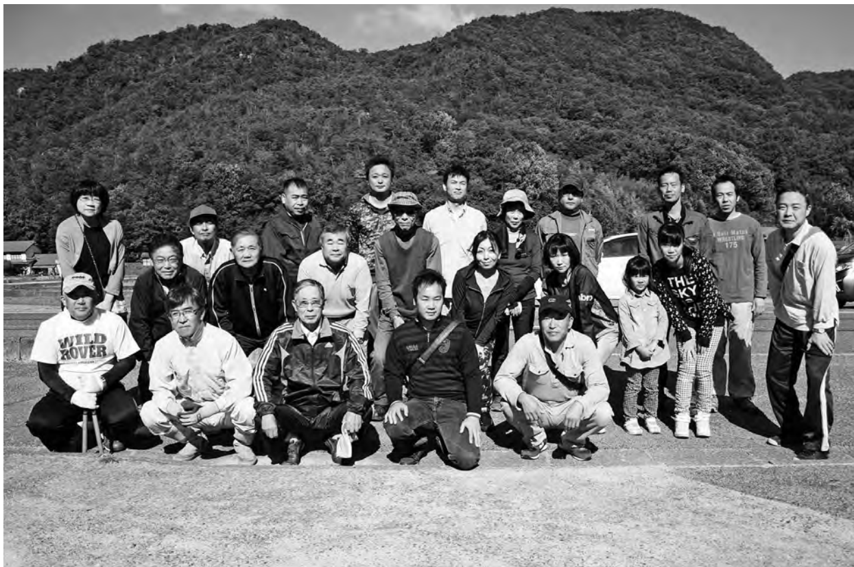
ももその学園清掃奉仕活動