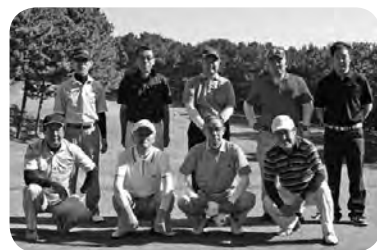
成 績 表