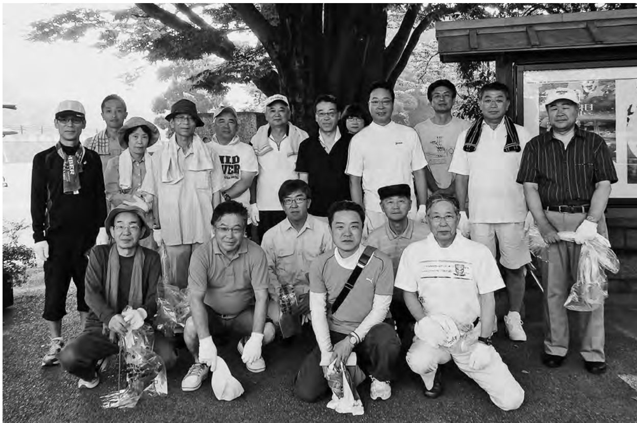
旭川一斉清掃活動