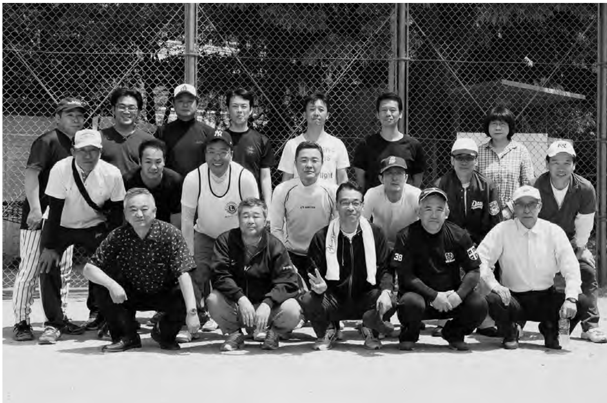
ライオンピック ソフトボール大会