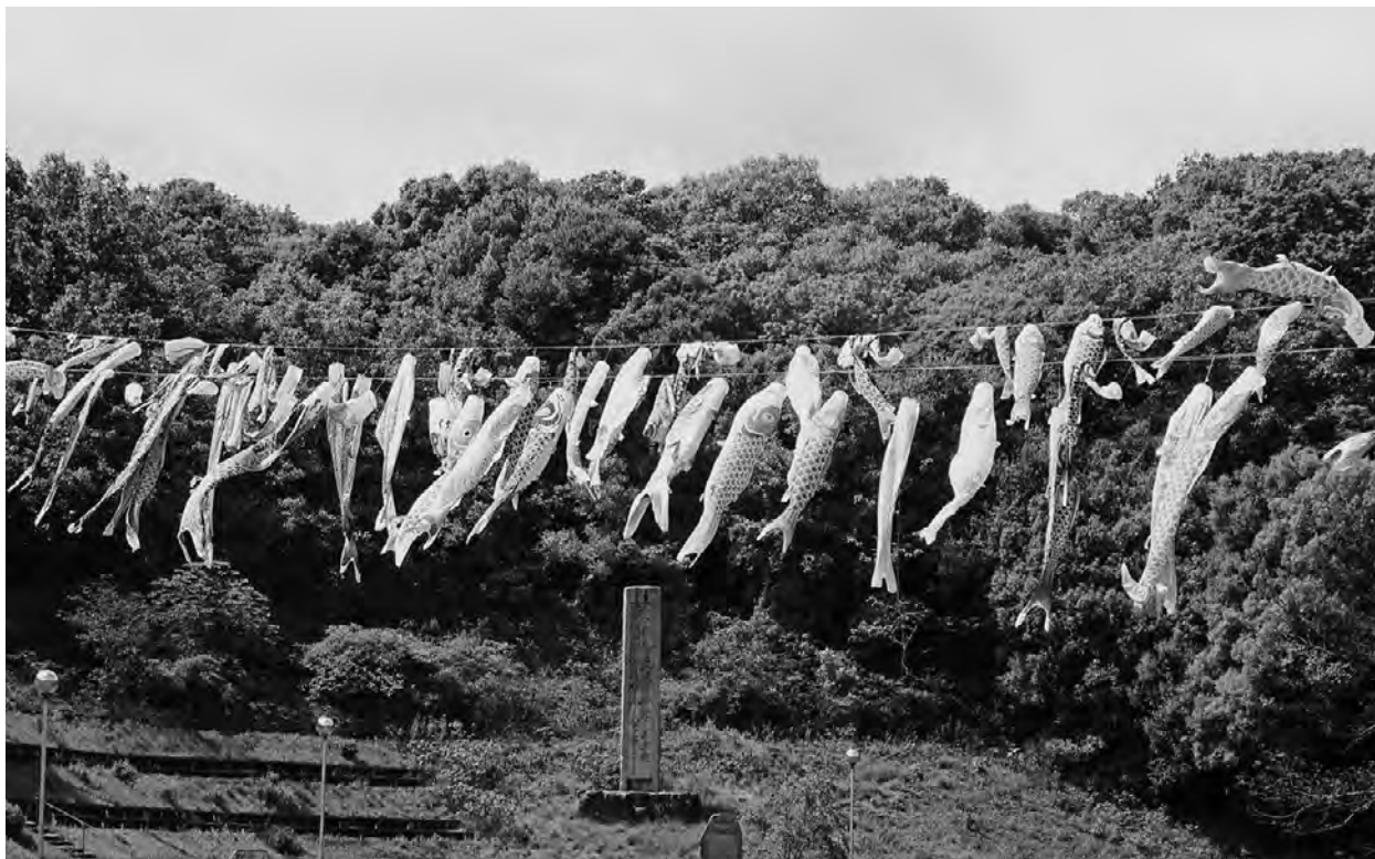
神道山を泳ぐこいのぼり（岡山市北区）